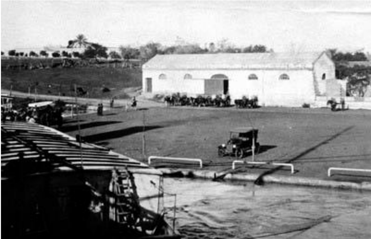
1 VERNAZ- CONTE GRAND. "Historia de San José y Colón". Fascículo Nº 3 de la Subsecretaría de Cultura de Entre Ríos. 1987. Entrevista mantenida con el historiador Prof. Conte Grand (Mayo de 2009).

Todos sus edificios en buena conservación, pese a su edad, están en uso actualmente para diferentes actividades comerciales y de albergue. Poseen una sobria fachada de ladrillos desnudos, con trabajos en sus muros de pilastras y molduras de corte neoclásico, a pesar de no estar revocados.